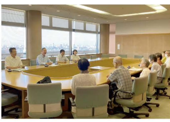
写真は昨年度の意見交換会の様子

令和7年度の文京区予算編成に向けて、16の各種団体様との意見交換会を開催しました。限られた時間でしたが、貴重なご意見・ご要望を頂戴しました。予算に反映するべく全力で取り組んでまいります。