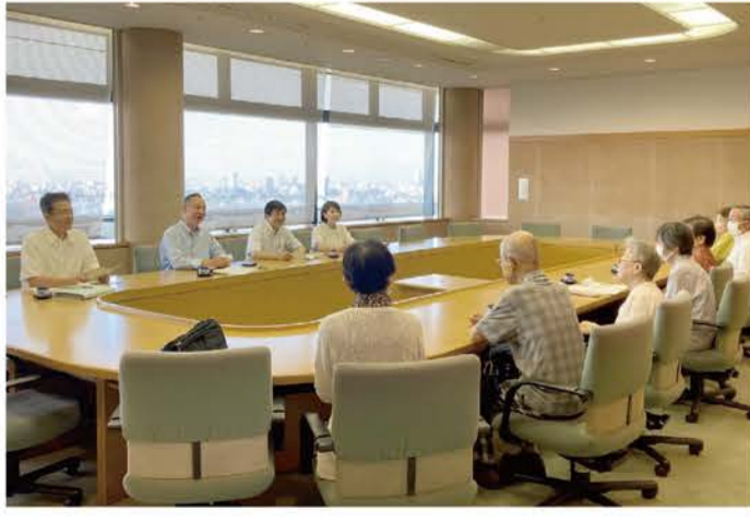
写真は昨年度の意見交換会の様子

令和7年度の文京区予算編成に向けて、16の各種団体様との意見交換会を開催しました。限られた時間でしたが、貴重なご意見・ご要望を頂戴しました。予算に反映するべく全力で取り組んでまいります。